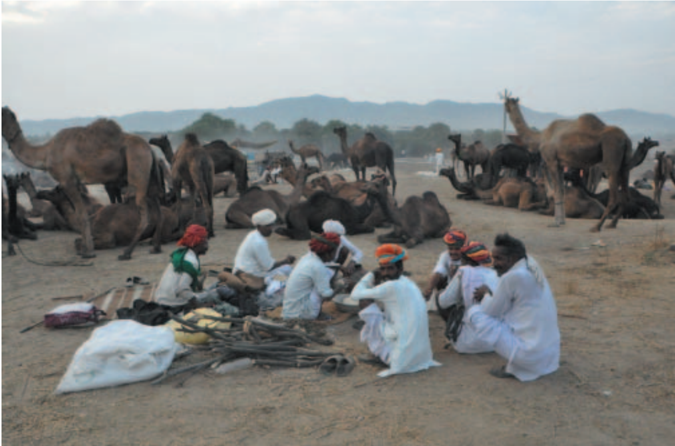
Στην πόλη Pushkar στην περιοχή Ajmer γίνεται κάθε χρόνο ένα από τα μεγαλύτερα φεστιβάλ καμήλας της Ινδίας. Καμηλιέρηδες από όλη τη χώρα μαζεύονται και επί μία εβδομάδα εμπορεύονται τα όμορφα ζώα τους. Το φεστιβάλ έχει διπλό χαρακτήρα, εμπόριο καμήλας αλλά και εντυπωσιακές θρησκευτικές τελετές γύρω από την ιερή λίμνη του Pushkar.