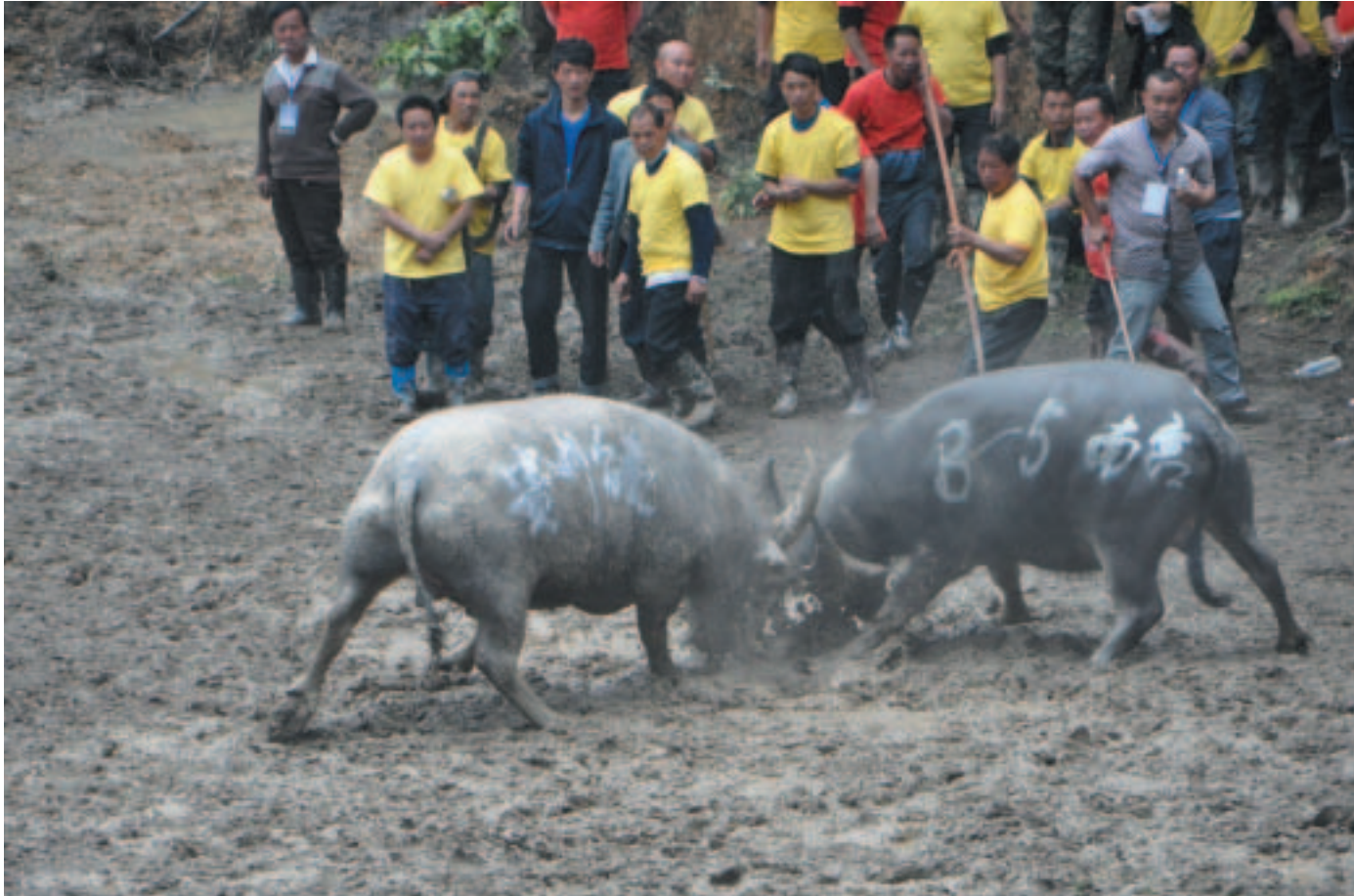
Στην πόλη Tanjang της επαρχίας Guizhou της Ν.Δ. Κίνας οργανώνονται κάθε χρόνο βουβαλομαχίες που συγκεντρώνουν πλήθος κατοίκων που ως γνωστόν αγαπούν πολύ τον τζόγο. Εκεί λοιπόν στοιχηματίζουν ποιο ζώο θα υπερισχύσει.