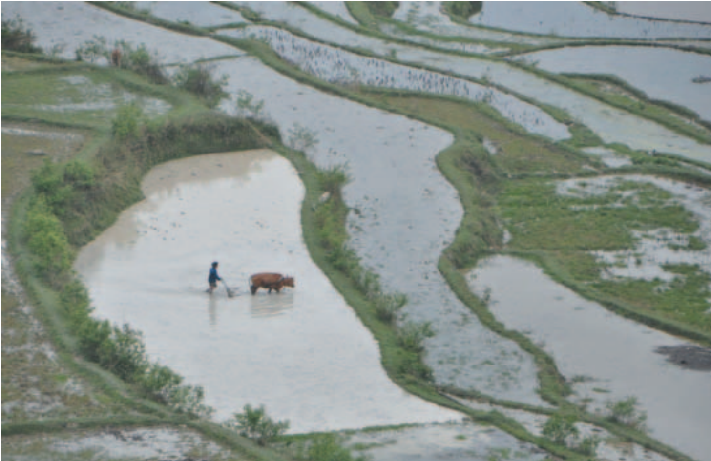
Το ρύζι τρέφει εδώ και αιώνες τεράστιο αριθμό ανθρώπων στην Ασία. Τα όμορφα ρυζοχώραφα είναι απόλαυση για το βλέμμα.