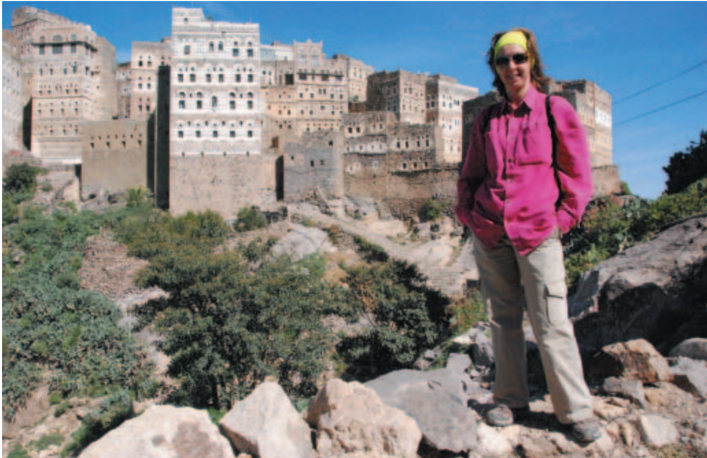
Τα Υμενίτικα καστροχώρια σε μεταφέρουν κατ' ευθείαν μέσα στα μουσουλμανικά χειρόγραφα. Παλιές πολιτείες ενός απρόσιτου κόσμου. Το πιο όμορφο απ' όλα η Χατζζάρα χτισμένη το 12ο αιώνα στα χρόνια της δυναστείας των Σουλαγίντ. Τα τεράστια πέτρινα σπίτια είναι χτισμένα χωρίς θεμέλια. Είναι στημένα πάνω στο βράχο αποτελώντας προέκτασή του.