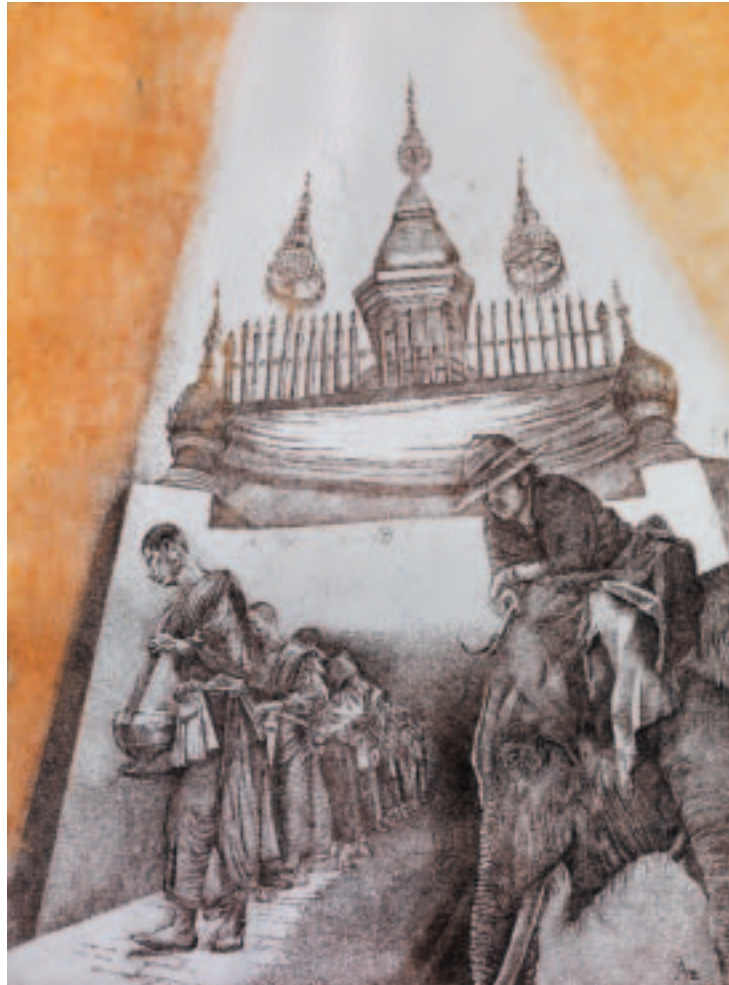
Luang Prabang. Oxygraphy depicting Buddhist monks in Laos. Dimensions: 30x40 cm.