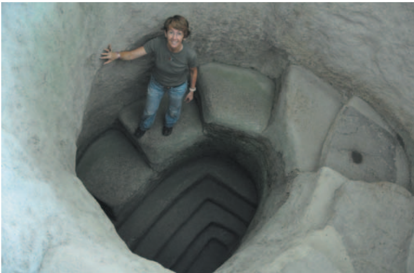
Στο Τιεραντέντρο της Κολομβίας επισκέφτηκα τους προκολομβιανούς ταφικούς θαλάμους του Άλτο Σεγκόβια, οι οποίοι είναι προσπελάσιμοι από ανοίγματα στο έδαφος εφοδιασμένα με πέτρινες σκάλες μεγάλης αισθητικής αξίας. Χρονολογούνται από τον 6ο έως τον 10ο αιώνα. Πρόκειται για έναν αγροτικό πολιτισμό με ιδιαίτερα ανεπτυγμένα έθιμα λατρείας των νεκρών.